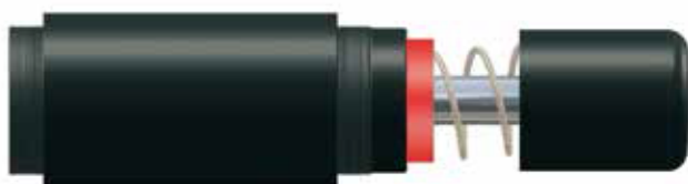
Mega-Line 3,0 Seite 48 / Page 48 Page 48 / Pagina 48 Pàgina 48